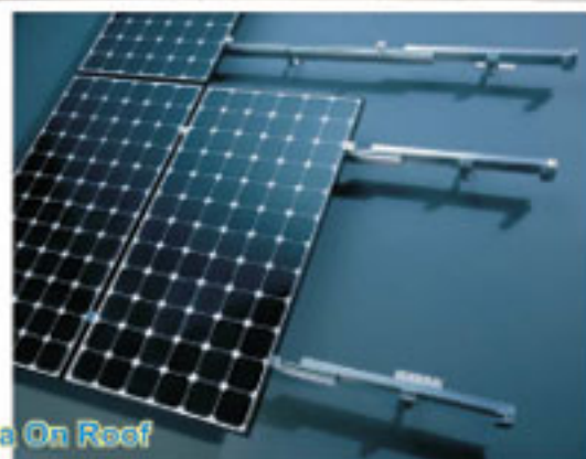
Sistema On Roof